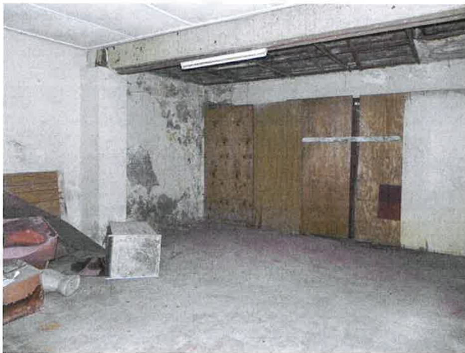
Foto 2 Winkelruimte

RvM Design & Taxaties Kaya Drs. Oy Sprock 60, Curaçao Tel. (5999)562-0824 • E-mail rvm1402@gmail.com Crib nummer 102264144 • Kamer van Koophandel Curaçao nummer 108316