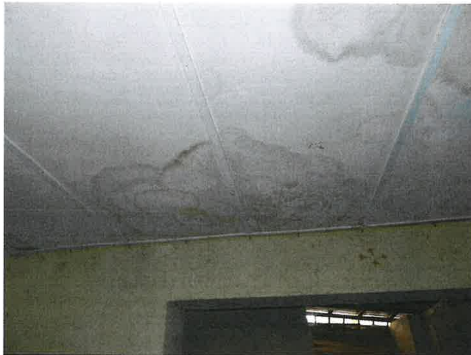
Foto 5 Plafonddetail