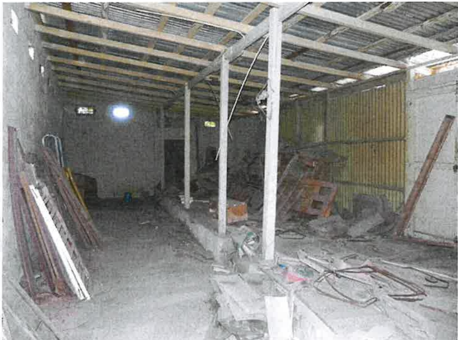
Foto 4 Opslag

RvM Design & Taxaties Kaya Drs. Oy Sprock 60, Curaçao Tel. (5999)562-0824 • E-mail rvm1402@gmail.com Crib nummer 102264144 • Kamer van Koophandel Curaçao nummer 108316