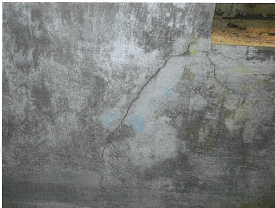
Foto 10 Muurdetail

RvM Design & Taxaties Kaya Drs. Oy Sprock 60, Curaçao Tel. (5999)562-0824 • E-mail rvm1402@gmail.com Crib nummer 102264144 • Kamer van Koophandel Curaçao nummer 108316