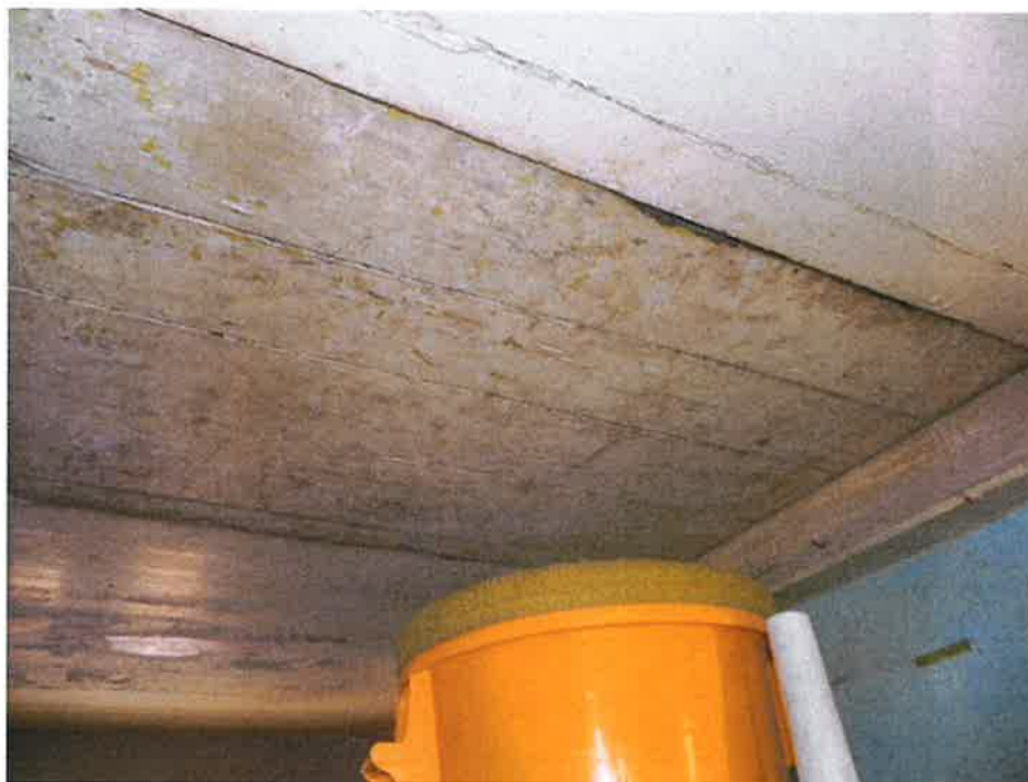
Foto 9 Plafonddetail verdieping