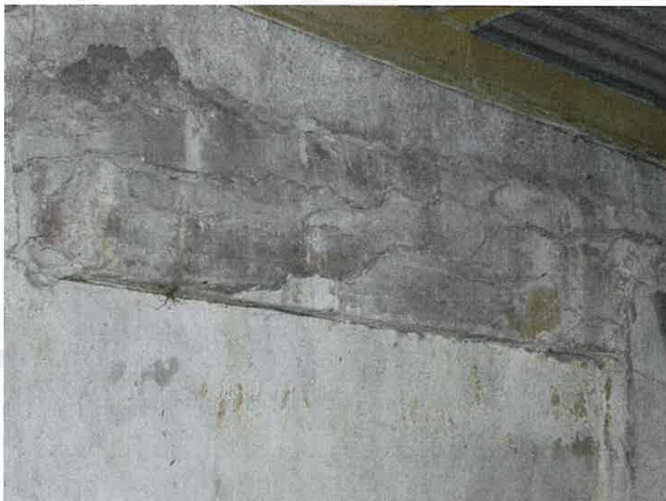
Foto 6 Muurdetail

RvM Design & Taxaties Kaya Drs. Oy Sprock 60, Curaçao Tel. (5999)562-0824 • E-mail rvm1402@gmail.com Crib nummer 102264144 • Kamer van Koophandel Curaçao nummer 108316