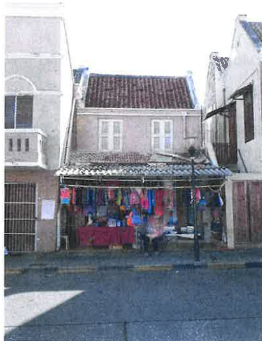
Foto 1 Vooraanzicht