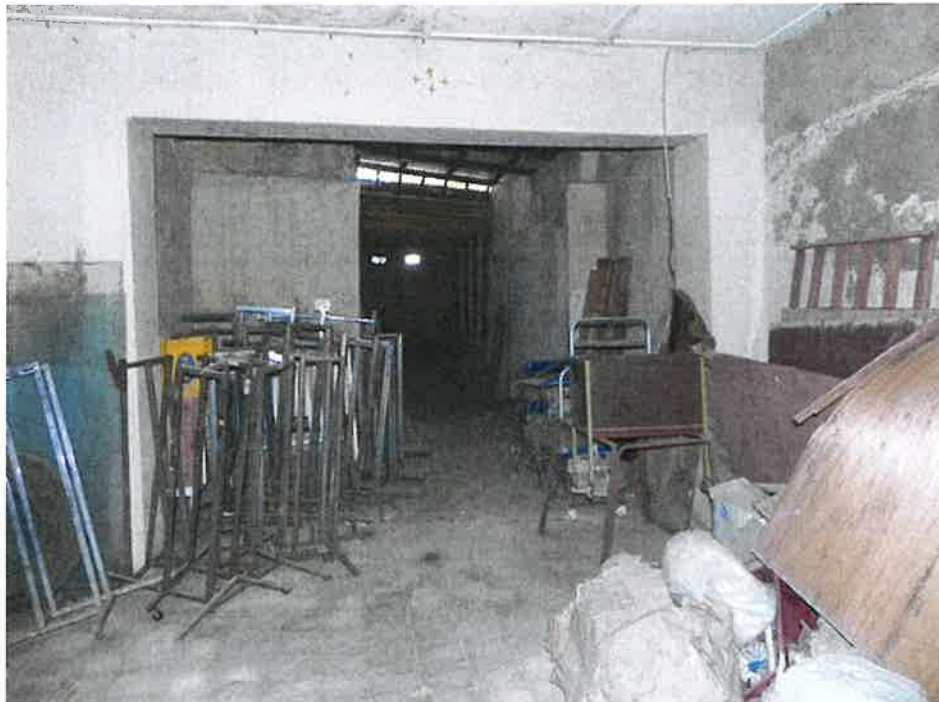
Foto 3 Winkelruimte